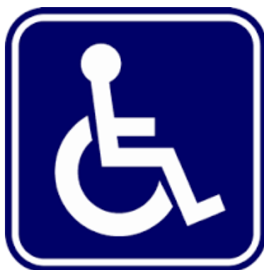
สัญลักษณ์ผู้พิการ